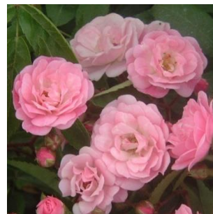
Numero di petali: variabile, massimo 30

ROSE ANTICHE: Concetto molto ampio e generico che raccoglie in sé un gran numero di categorie, tra cui: Ibridi Perpetui, Muscose, Bourbon, Galliche, Tea, Rambler, Alba, Noisette, Ibridi di Wichuraiana, Ibridi di Spinosissima, Ibridi di Roxburghii, Portland, Ibridi di Rugosa, Ibridi di Chinensis, Wild, Ibridi di Banxiae, Centifolie.