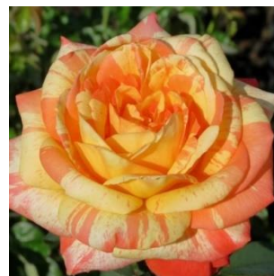
Numero di petali: solitamente più di 70

IBRIDI DI MOSCHATA (mezz'ombra): Rose simili alla rosa canina (o selvatica), con fiori medio-piccoli spesso raccolti in mazzetti, ideali per le case di campagna. Crescono bene anche in zone di mezz'ombra (cioè con solo 3-4 ore di luce diretta al giorno).