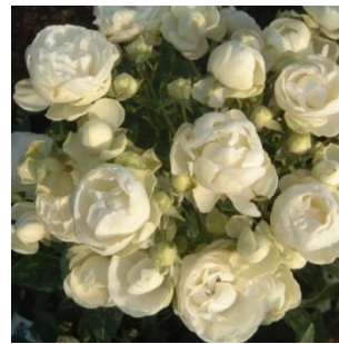
Numero di petali: massimo 40

TAPPEZZANTI: Rose striscianti e autopulenti. Di solito restano basse, necessitano di pochissima manutenzione, ma fanno fiori non di grandissimo pregio.