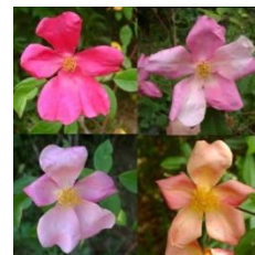
Numero di petali: variabile a seconda della categoria